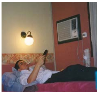
2002-Hotel. La Carlota, Córdoba, Argentina.