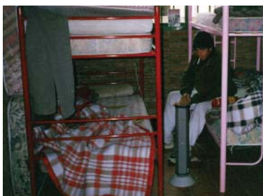
2002-Albergue Municipal. Jesús María, Córdoba, Argentina.