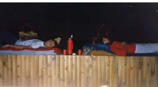
2002-Teatro La Fachada. Santa Isabel, Santa Fe, Argentina.