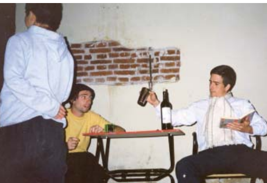
2002-Centro de Expresión Joven. Venado Tuerto, Santa Fe, Argentina. Representando escena de un cuento de Fontanarrosa.